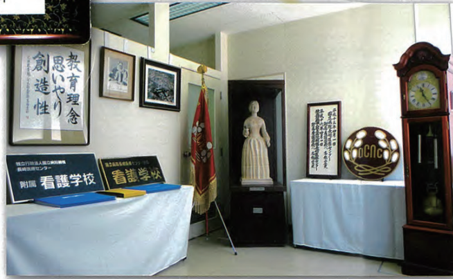
お待ちしております