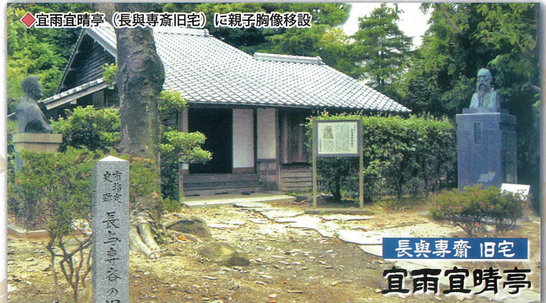
◆宜雨宜晴亭 (長與専齋旧宅) に親子胸像移設