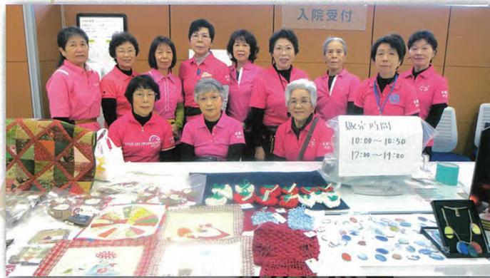
◆医療センター 健康フェスタ参加 (バザー)